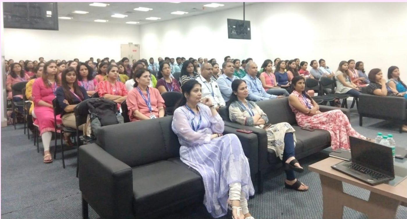
3- ATHASHRI, BANER